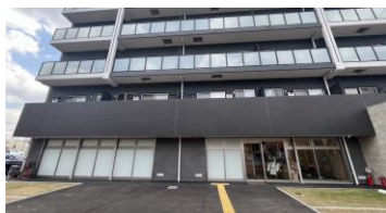
■本社外観(本社は1階フロアのみ)

2022年12月23日に東京証券取引所スタンダード市場に上場。同日に、福岡証券取引所本則市場に市場変更。近年は賃貸事業も展開中。